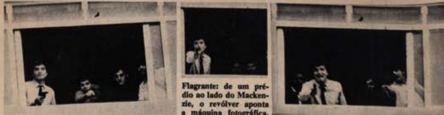
Flagrante: de um prédio ao lado do Mackenzie, o revólver aponta a máquina fotográfica.

Paus e pedras, bombas Molotov, rojões, vidros cheios de ácido sulfúrico que ao estourar queimavam a pele e a carne, tiros de revólver e muitos palavrões voaram durante quatro horas pelos poucos metros que separam as calçadas da Universidade Mackenzie e da Faculdade de Filosofia, Ciências e Letras da Universidade de São Paulo. Exatamente às 10 e meia da manhã do dia 2, quarta-feira, começou a briga entre as duas escolas. Porque alguns alunos do Mackenzie atiraram ovos em estudantes que cobravam pedágio na Rua Maria Antônia a fim de recolher dinheiro para o Congresso da ex-UNE e outros movimentos