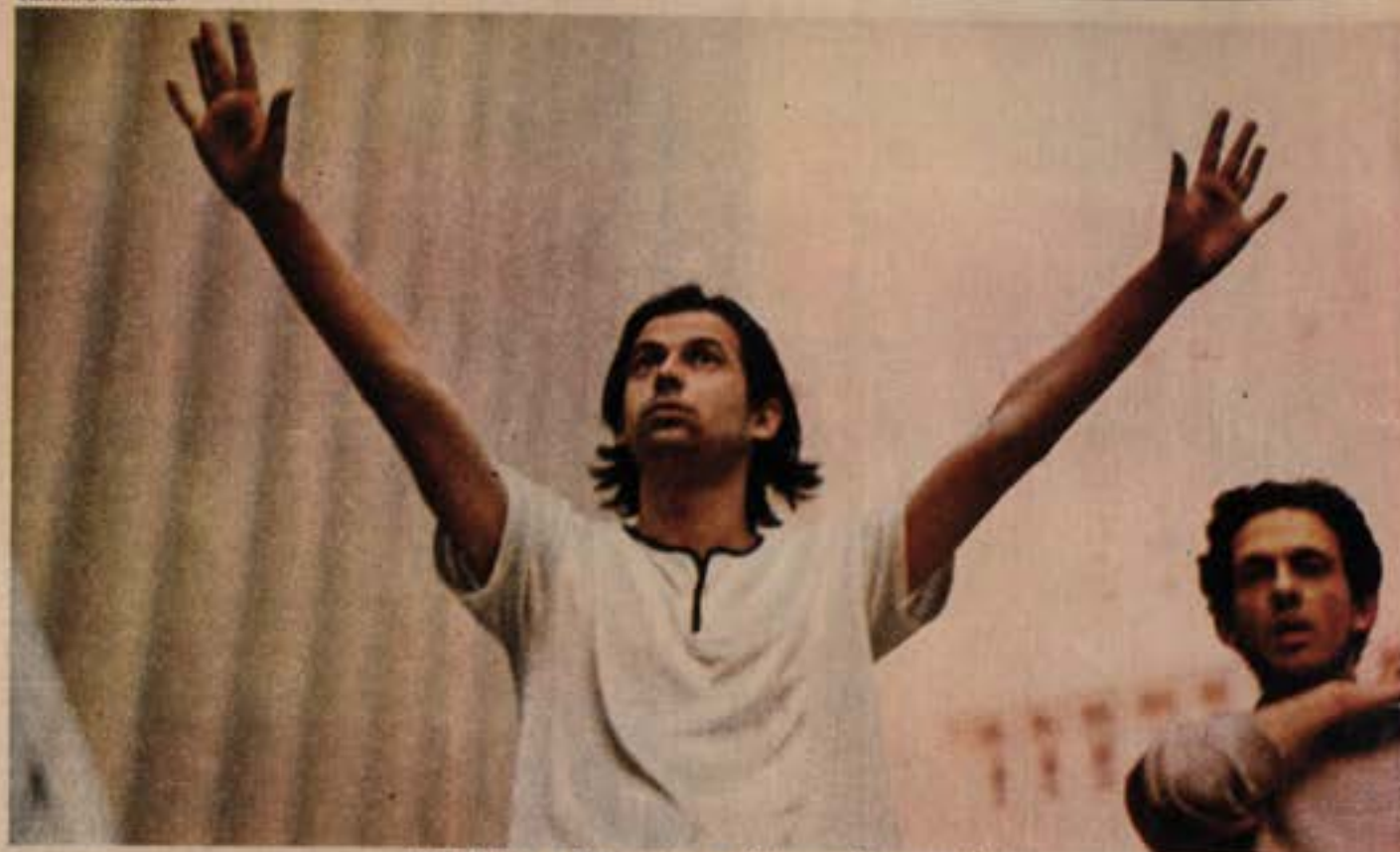
José Dirceu e Travassos: os líderes estão cansados.