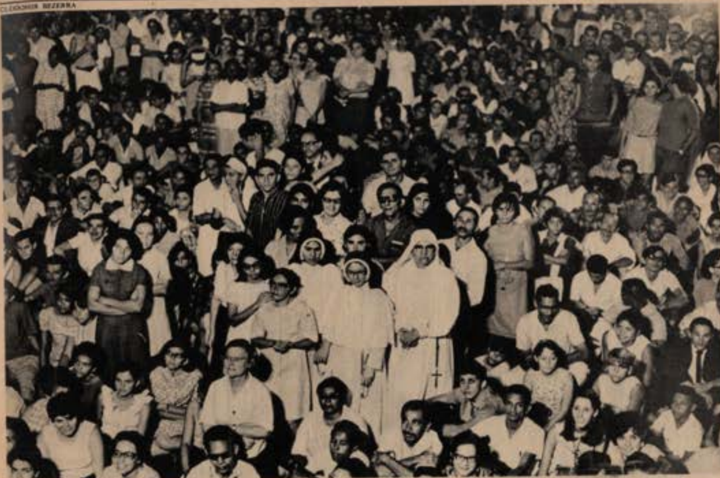
Esse movimento é para todos os que acreditam no valor do homem: 600 pessoas ouviram Dom Helder no Recife.

A escolha do nome foi muito discutida, porque o objetivo era o de criar um movimento aberto a adesões vindas de todas as partes. Os fundadores do movimento acham conveniente lançá-lo com nomes diferentes em várias partes do Brasil, para facilitar seu trabalho e fugir a possíveis repressões. Na defesa da mesma idéia, os métodos poderão variar de acordo com as circunstâncias. Em todo caso, pretende-se demonstrar que a atitude de não-violência é prova de ação e coragem e não de passividade e fraqueza.