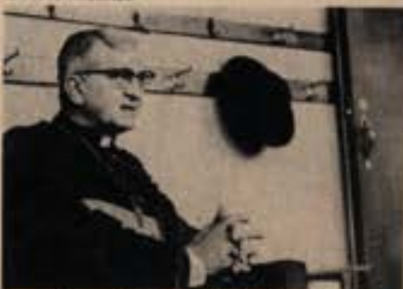
Dom Agnelo: o sentido de um gesto.