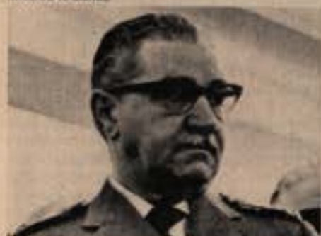
Ministro Souza e Melo: tudo é paz.

nota oficial curta e formal, mas o assunto não morreu. Deputados da oposição insistiram na denúncia, anunciando que tinham em mãos "documentos pormenorizados". Segundo esses documentos, o Brigadeiro Burnier, o homem que criou e chefiou o Centro de Informações da Aeronáutica, reuniu a equipe do Para-Sar para solicitar seu emprego na eliminação de subversivos. Os líderes "irrecuperáveis" seriam raptados e atirados ao mar de aviões, a 40 quilômetros do litoral. A denúncia coincidiu com a exoneração do Brigadeiro Itamar Rocha — que "se recusou a transformar o Para-Sar num órgão repressivo", segundo seus familiares — e com a punição de dois oficiais da unidade. Oficialmente, tanto a exoneração do Brigadeiro como a punição dos dois oficiais são atos de rotina.