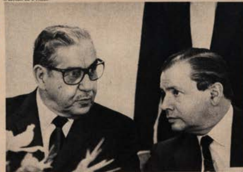
Costa e Silva e Sodré: o Governador também fala de golpe ao Presidente.